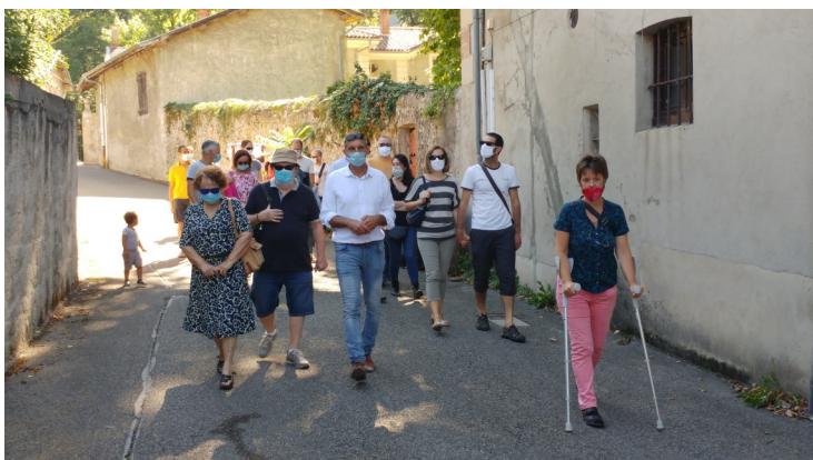
Près de 15 familles ont participé à l'accueil des nouveaux habitants le 5 septembre. L'occasion de découvrir notre village et ses projets en compagnie du maire et de quelques élus.

Les inscriptions aux commissions sont ouvertes et nous sommes à la recherche d'habitants pour venir participer au sein de celle dédiée aux seniors. Son objectif est de travailler ensemble, élus et habitants, sur le développement d'actions à destination des seniors et de les représenter dûment au sein de la municipalité. Pour toute information ou inscription, merci de contacter la mairie au 04 76 55 00 78.